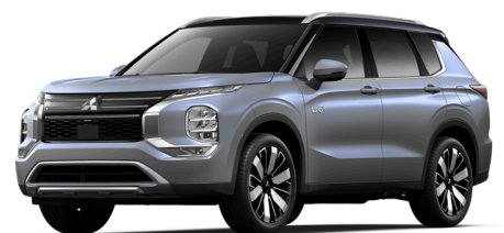
Moonstone Grey mustalla katolla