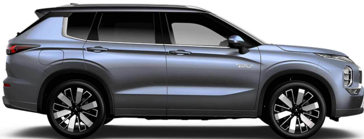
Kuvassa Outlander PHEV Business Instyle

18" Machined kevytmetallivanteet & 235 / 60 R18 -renkaat Nämä renkaat saatavilla varustetasoissa | Invite