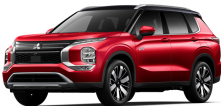
Red Diamond mustalla katolla