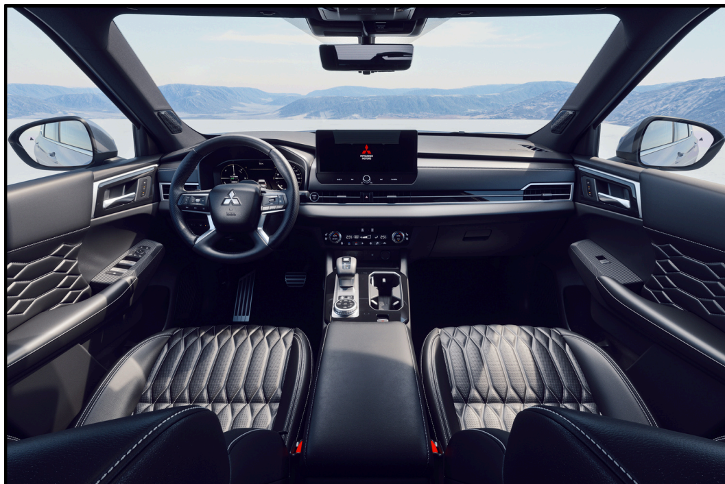
Musta nahkaverhoilu Saatavilla varustetasossa Instyle