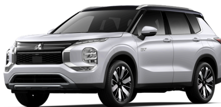
White Diamond mustalla katolla