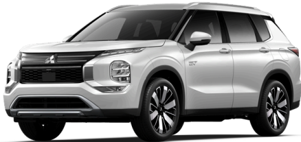
Perusväri | Solid White